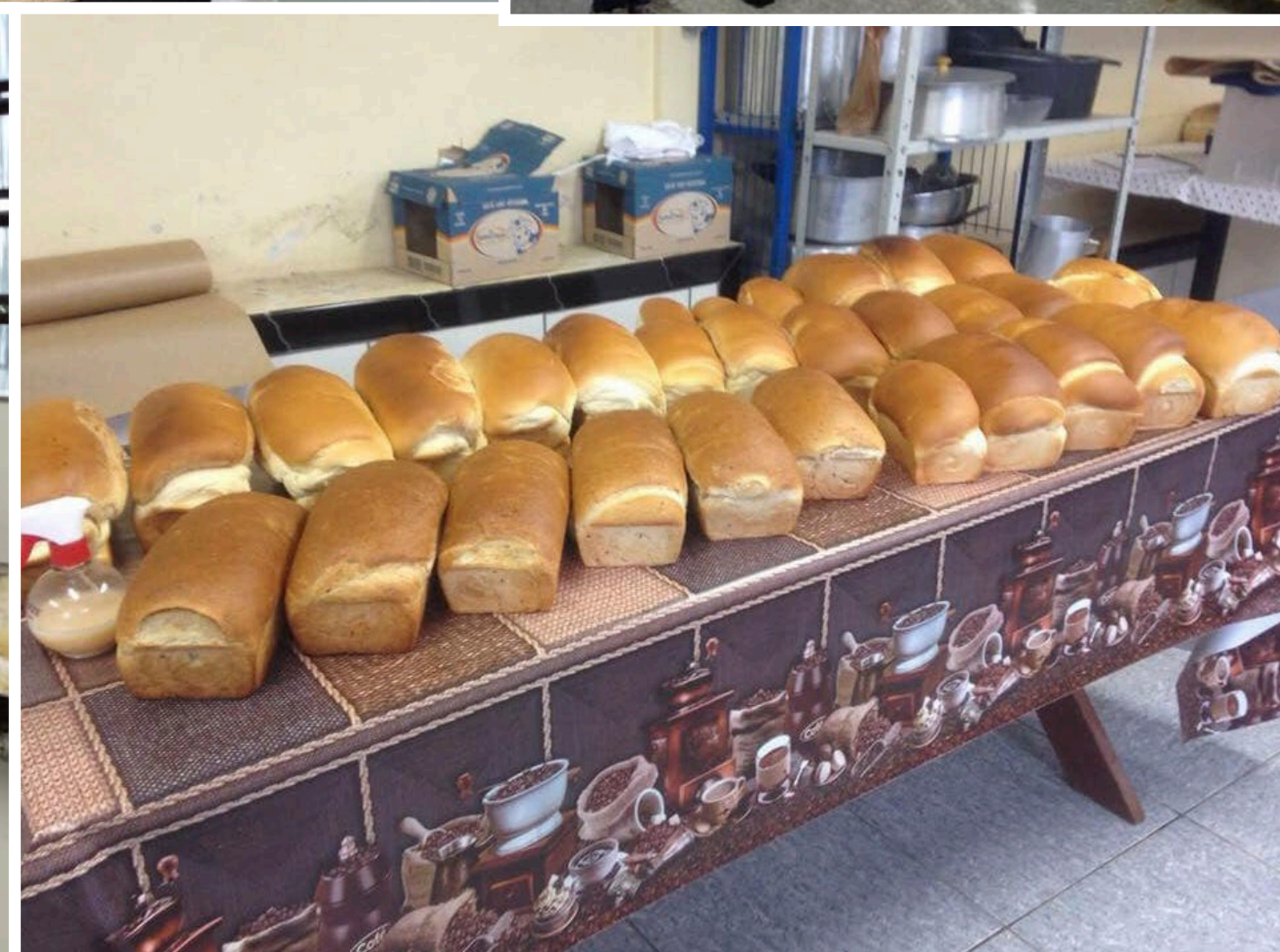
LAR EMILIANO LOPES - BASE EM PASSO FUNDO - RS