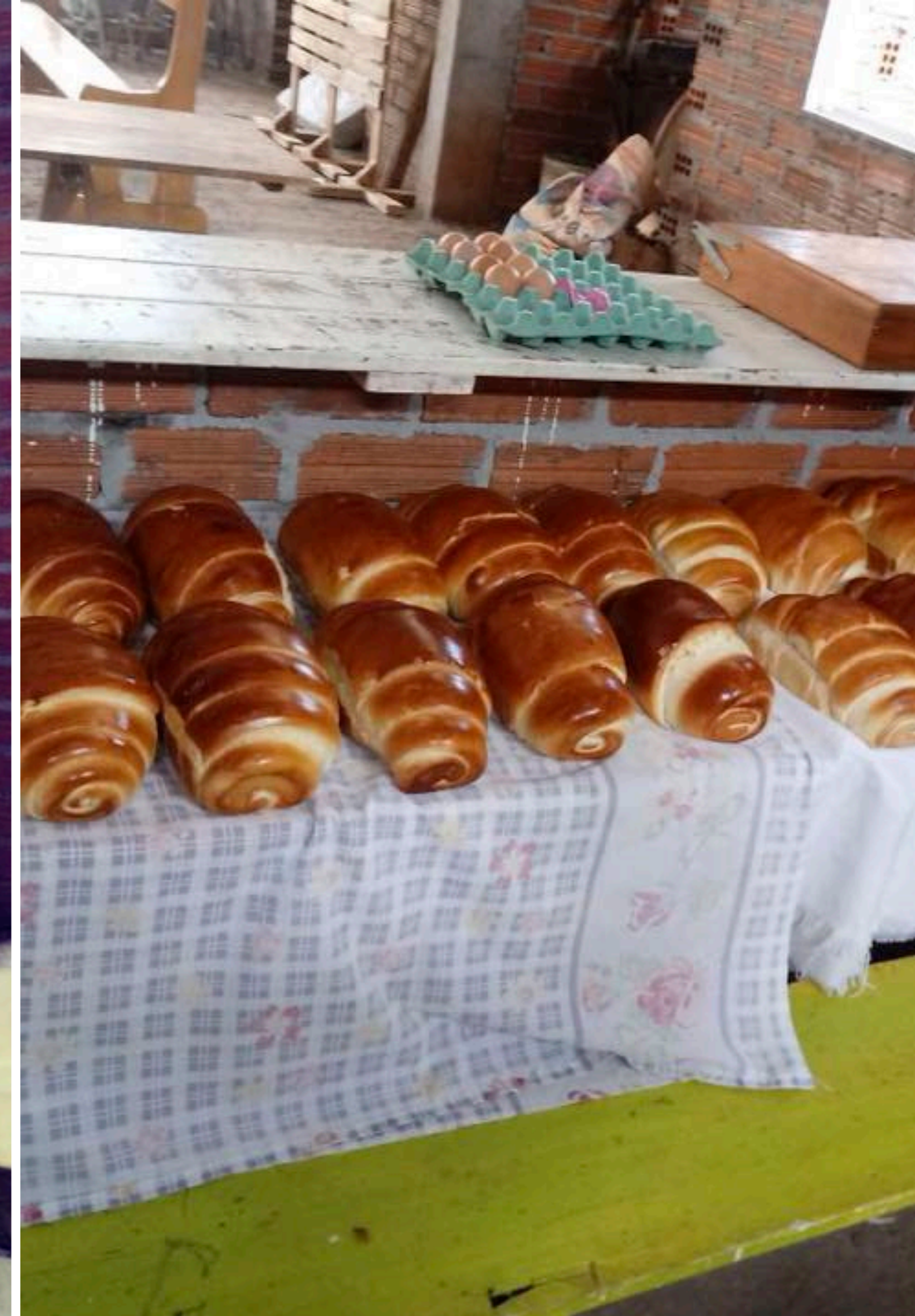
LAR EMILIANO LOPES - BASE EM VIADUTOS - RS